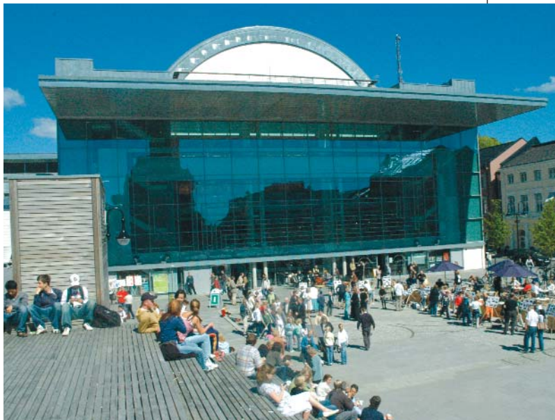
DOBBELTBYGG: Arendals nye kultur- og rådhus.

Hele det 12 000 kvadratmeter store dobbeltbygget har kostet over 300 mil-